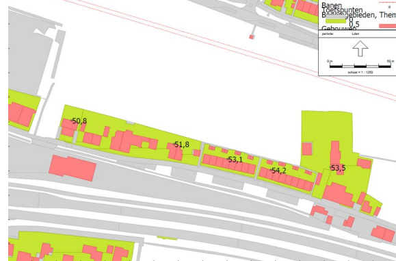
Geluidbelasting metro huidige situatie