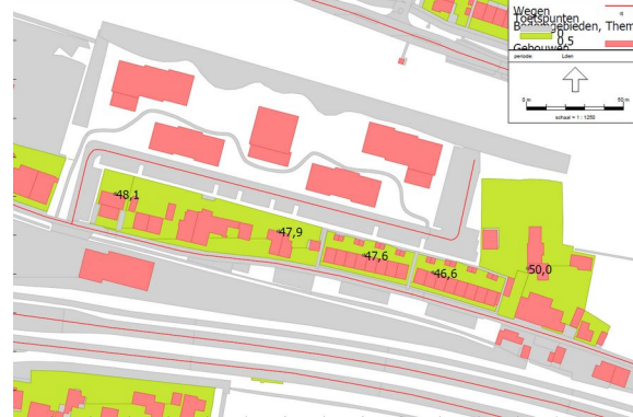
Geluidbelasting wegverkeer toekomstige situatie