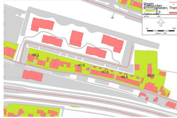
Geluidbelasting wegverkeer toekomstige situatie