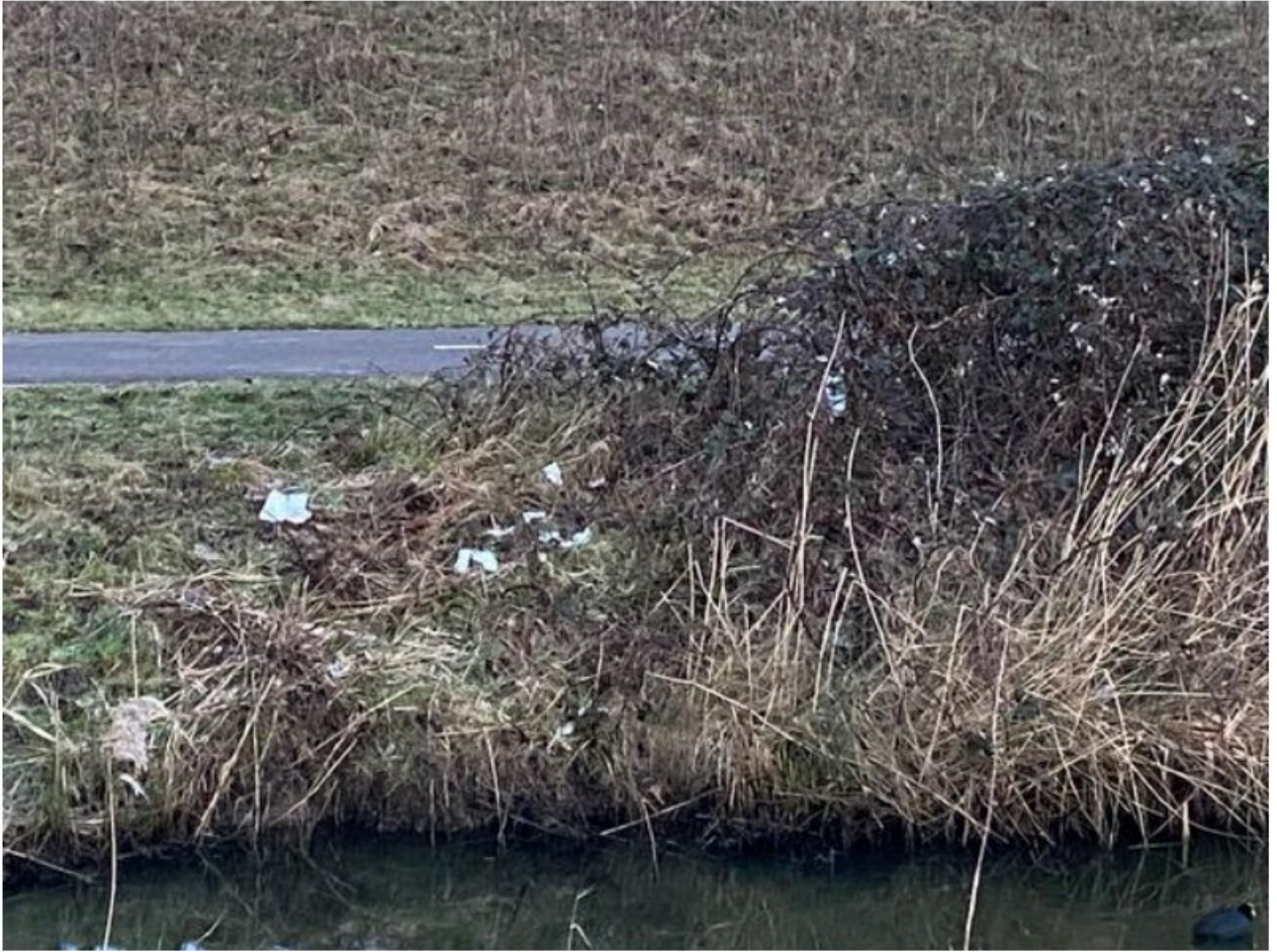
Verstuurd vanaf mijn iPad