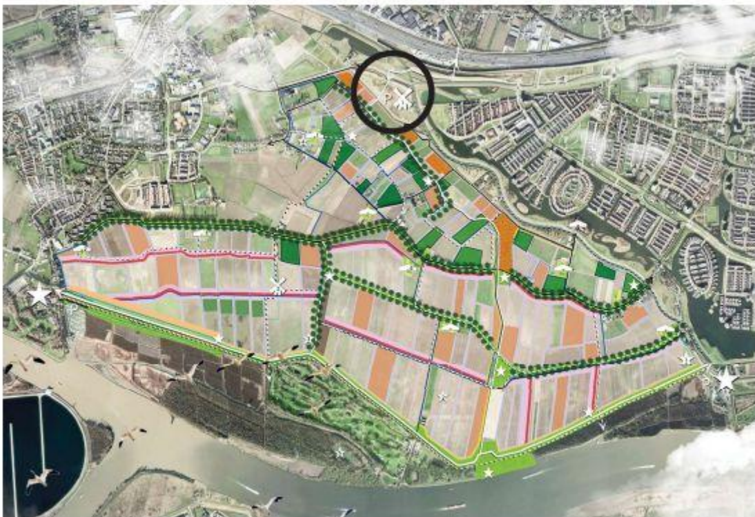
Het streefbeeld uit 2018

Voor molen 't Hert, oorspronkelijk gebouwd op de hoek Dorpsdijk/Rhoonsedijk is een mooie locatie bedacht, zoals ook in het streefbeeld staat, namelijk bij de entree van de polders, de Poort Buitenland van Rhoon.