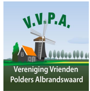
Optie 2: Inpassing Molen 't Hert