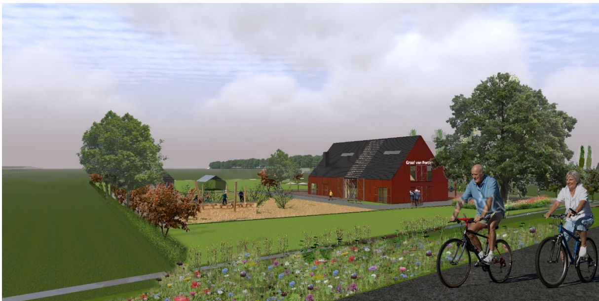
Impressie vanaf Koedood

Begin 2019 heb ik de plannen aan de buurt gepresenteerd en afgelopen zomer heb ik meerdere bewoners op mijn erf uitgenodigd. Veel (import)-omwonenden maken zich zorgen over geluid-, licht- en parkeeroverlast met de komst van de Graaf van Portland . Ik begrijp die zorgen en we hebben dit najaar ook het plan op een aantal punten aangepast.