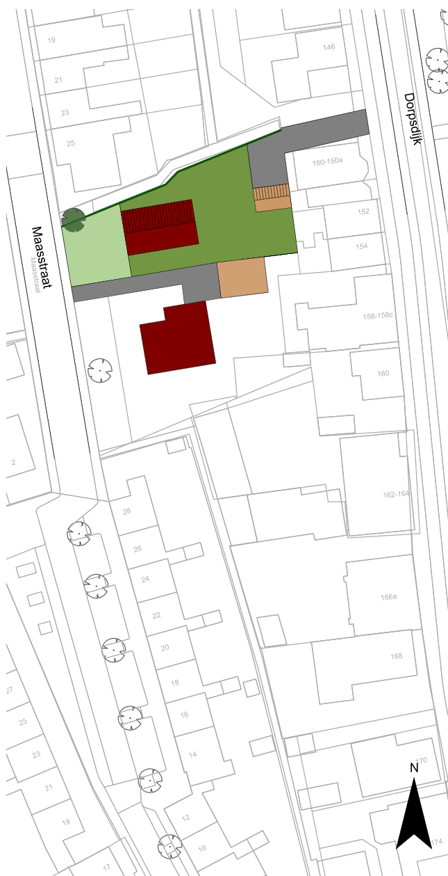
Indicatieve schets ontsluiting via Dorpsdijk