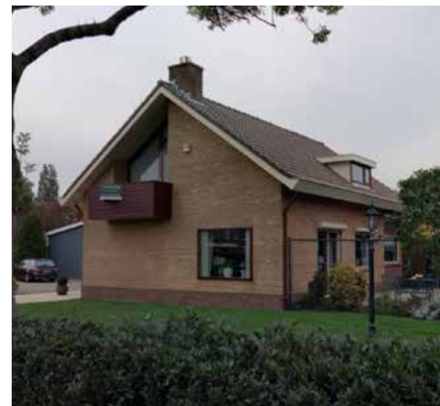
referentie bestaande vrijstaande woning Maasstraat 27

De nieuwe woning is opgebouwd uit één laag met een kap. De architectuur en vormgeving van de nieuwe woning dient aan te sluiten bij de bestaande woning. Op deze manier worden deze twee woningen een eenheid en blijft de ruimtelijke impact van de extra woning op het ruimtelijke beeld van de omgeving minimaal. De nieuwe woning heeft een helder en eenvoudig hoofdvolume. Eventuele bijgebouwen en uit- en aanbouwen hebben een sober karakter en staan op het achtererf achter het hoofdgebouw. De voorzijde van de woning is gericht op de Maasstraat.