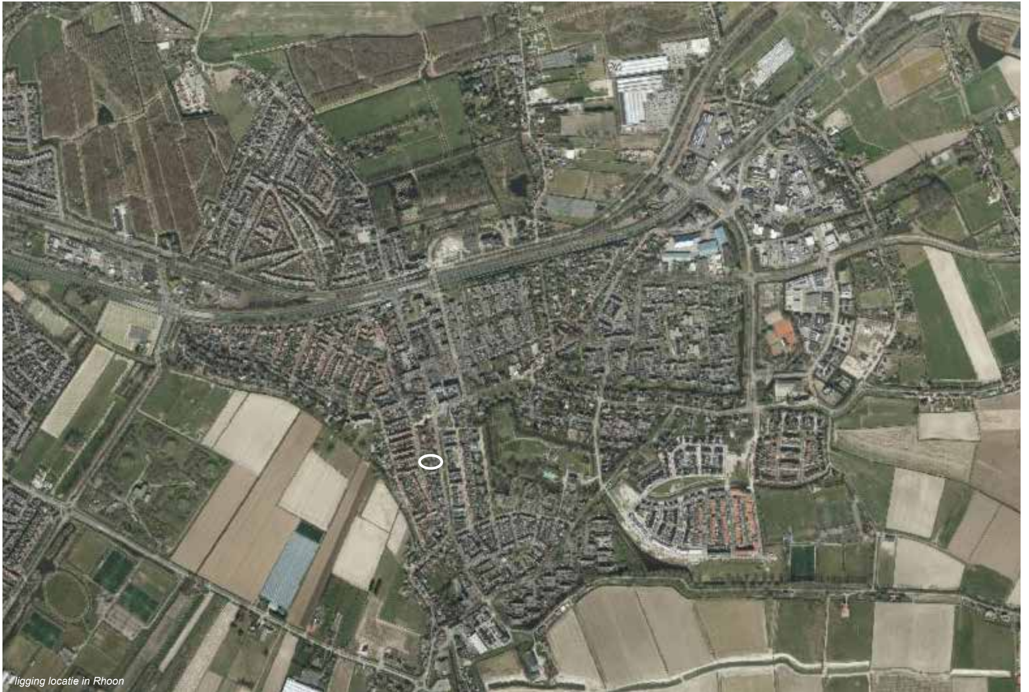
ligging locatie in Rhoon