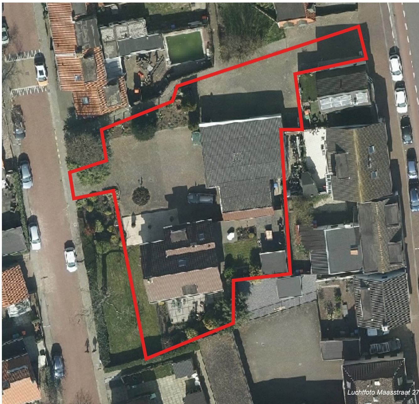
Luchtfoto Maasstraat 27

Het huidige perceel heeft een oppervlakte van totaal 1.262 m 2 .