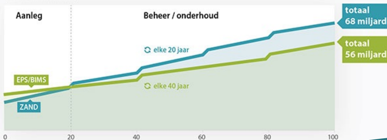
Kosten over 100 jaar (nominale waarden)

Ook kan de gemeente haar inwoners helpen die te maken hebben met funderingsschade. In de gebiedsprocessen in de veenweidegebieden hebben gemeen-