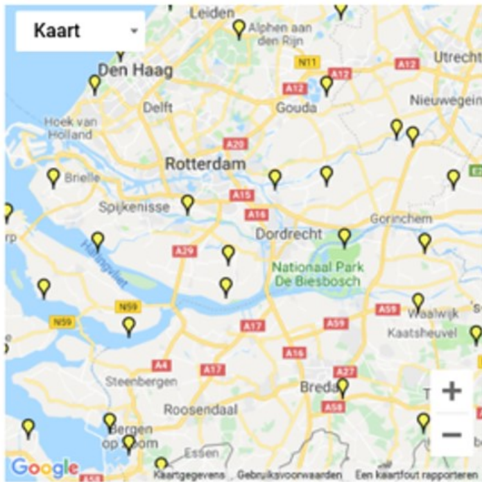
Overzicht Natura 2000-gebieden