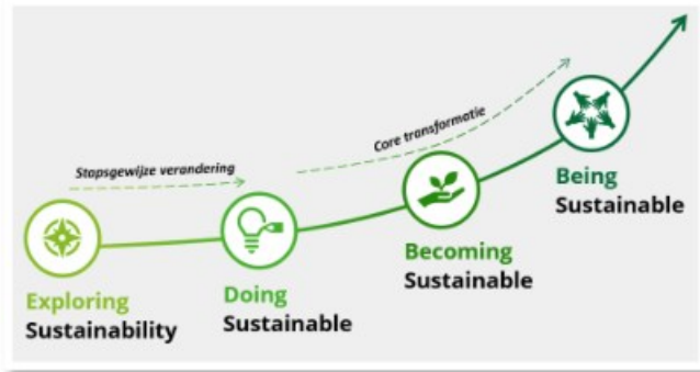
Figuur 1 Fasen van duurzaamheidsambitie

Door deze toenemende maatschappelijke aandacht is ESG niet meer weg te denken als integraal onderdeel van de (langetermijn)strategie van de GR BAR-organisatie. Wij verwachten de komende jaren in toenemende mate een behoefte van gemeenten om zich te kunnen verantwoorden over het behalen van de gestelde duurzaamheidsambities. Om deze reden hebben wij ESG tot speerpunt van onze natuurlijke adviesfunctie gemaakt. De ESG Quickscan geeft u een beeld van de wijze waarop uw organisatie 'duurzaamheid' onderdeel maakt van haar strategie en beleid, en hoe de GR BAR-organisatie zich verantwoord over het gevoerde (duurzaamheids)beleid. De ESG Quickscan geeft nadrukkelijk geen oordeel over de mate waarin het beleid duurzaam is of niet. De ESG Quickscan geeft u inzicht in waar de GR BAR-organisatie staat ten opzichte van andere gemeenten en publieke organisaties en biedt de mogelijkheid om dit af te zetten tegen uw eigen ambitie. Dit gebeurt langs de lijn Exploring Sustainability , Doing Sustainable , Becoming Sustainable en Being Sustainable . Zie figuur 1 hieronder.