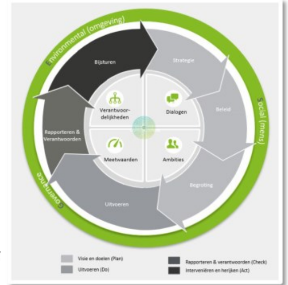
Figuur 2 Deloitte Green Wheel

Toelichting vier fases op de duurzaamheidsladder Exploring Sustainability betekent dat ambities zijn afgestemd op de minimale compliance-eisen. Restbudgetten worden aangewend voor duurzaamheidsinitiatieven. Doing Sustainable houdt in dat duurzaamheidsinitiatieven grotendeels gericht zijn op hetzelfde blijven doen, maar kijken of het wat duurzamer kan. Bij Becoming Sustainable worden stevige ambities op het gebied van duurzaamheid ondersteund met duidelijke routekaarten en de benodigde financiering. Een Being Sustainable organisatie draait volledig rond duurzaamheid en een regeneratieve economie. Duurzaamheid drijft de organisatie en zit in het DNA van de organisatie.