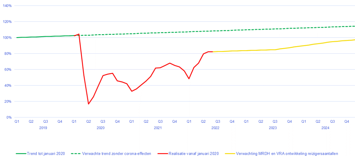
Instappers in stads- en streekvervoerMRDH

Na een stijging in de eerste maanden van 2022 zien we dat het OV-gebruik zich stabiliseert: zowel in mei als juni bedroeg het aantal OV-gebruikers 82% ten opzichte van dezelfde maand in 2019.