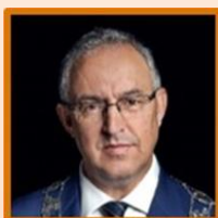
Burgemeester A. Aboutaleb, Voorzitter Coördinerend bestuurder

Zes leden uit het Algemeen Bestuur vormen het Dagelijks Bestuur. Het Dagelijks Bestuur is belast met de voorbereiding en uitvoering van de besluiten die het Algemeen Bestuur neemt. Ieder lid van het Dagelijks Bestuur heeft zijn / haar eigen portefeuille. Hieronder is de samenstelling van het Dagelijks Bestuur in 2022 opgenomen.