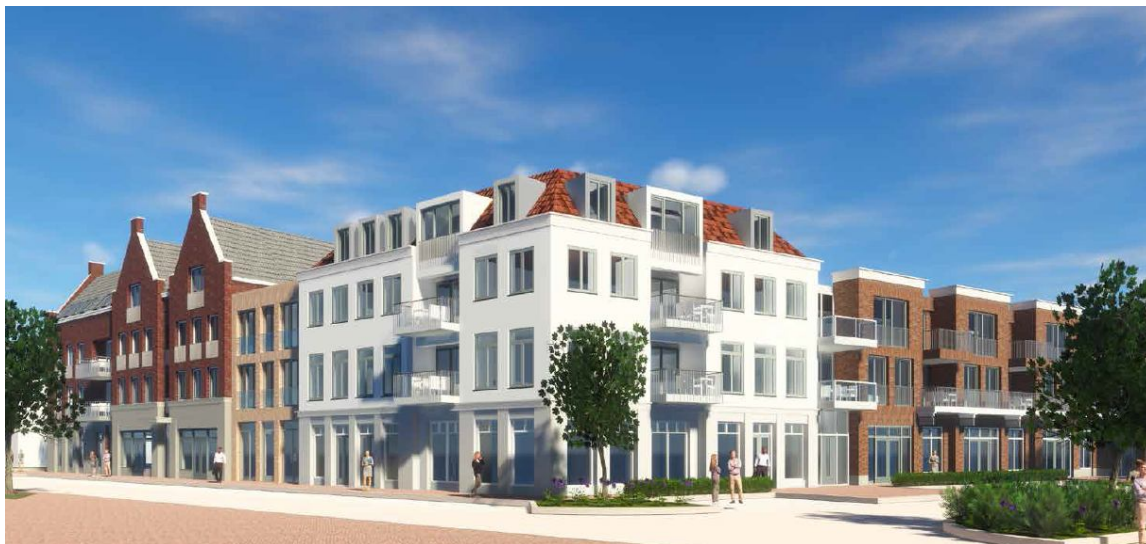
Vanaf het parkeerterrein bij de Aldi

Ter bevordering van hergebruik van in onbruik geraakte panden in de Dorpsstraat, Kerkstraat en Kikkerstraat worden via de zogenaamde kruimelgevallen-regeling nieuwe woonfuncties op de begane grond mogelijk gemaakt.