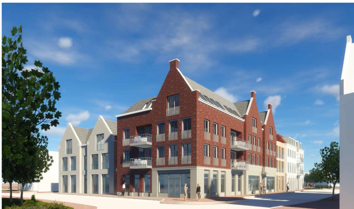
Hoek Waalstraat (links) - Emmastraat (rechts)

In het kader van inspraak en informeren zal er op donderdag 12 april 2018 vanaf 19.00 uur in de Brinkhoeve een inloopbijeenkomst georganiseerd worden, waarvoor u van harte bent uitgenodigd. Op deze avond zal er ook informatie over het voorlopig stedenbouwkundig ontwerp beschikbaar zijn.