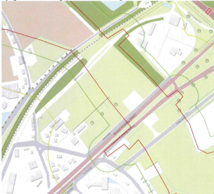
Bijlage: bestemmingsplan met afmetingen

Deze afbeeldingen geven de exacte zoneringen weer. Rood is de bestemming buisleidingenstraat plus 10 m. Groen veiligheidszone (55 m). Geel is toetsingsgebied (175 m).