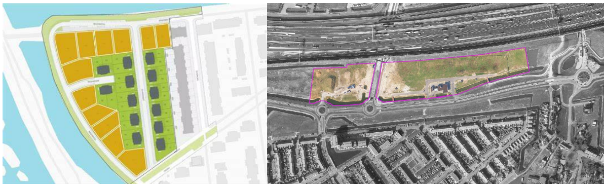
Links: Overzichtstekening van de laatste fase van Portlandse hoek

Het woningbouwproject Portlandse hoek wordt ontwikkeld door projectontwikkelaar BPD en bestaat uit 26 twee-onder-één kappers en 12 vrije kavelwoningen. Bedrijventerrein Portland bestaat uit 9 bedrijfskavels, die door de gemeente worden uitgegeven.