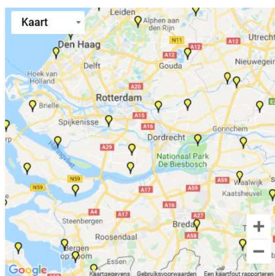
Overzicht Natura 2000-gebieden