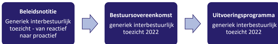
Figuur 1 van beleidsnotitie tot uitvoeringsprogramma

In 2020 is het interbestuurlijk toezicht in Zuid-Holland mede op basis van de input van de gemeenten geëvalueerd. Na de evaluatie organiseerde de provincie ambtelijke sessies en een bestuurlijke bijeenkomst met de gemeenten. De uitkomsten van de evaluatie en de input van de gemeenten zijn verwerkt in de Bestuursovereenkomst en betrokken bij de totstandkoming van dit Uitvoeringsprogramma. De Bestuursovereenkomst vormt de fundering voor het Uitvoeringsprogramma. Dit Uitvoeringsprogramma treedt in werking op 1 januari 2022 en blijft voor onbepaalde tijd van kracht totdat Gedeputeerde Staten hebben besloten tot de wijziging ervan. Het Uitvoeringsprogramma bevat informatie over: